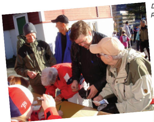
Det var kø ved påmeldingsbordet