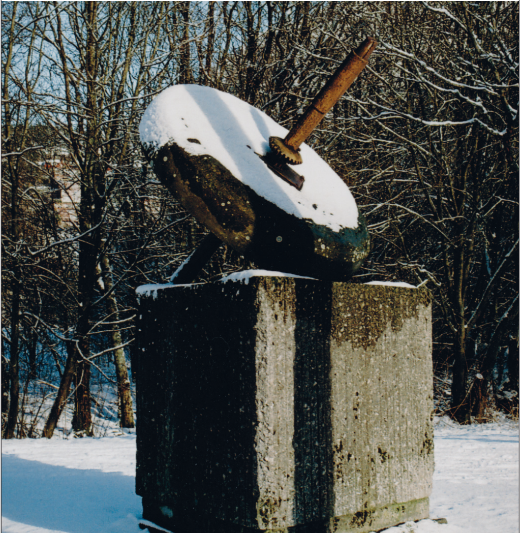
Slipsteinen i Lynghaugsparken