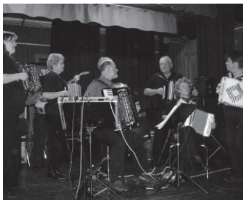
Liland Toraderklubb.

Kaffen smakte fortreffelig og kakene med Historielaget sin egen logo fikk også "ben å gå på". Dansen "gikk over tilje" til et stykke ut på den nye dagen før en avsluttet med "broderring" og "godnatt-sang".