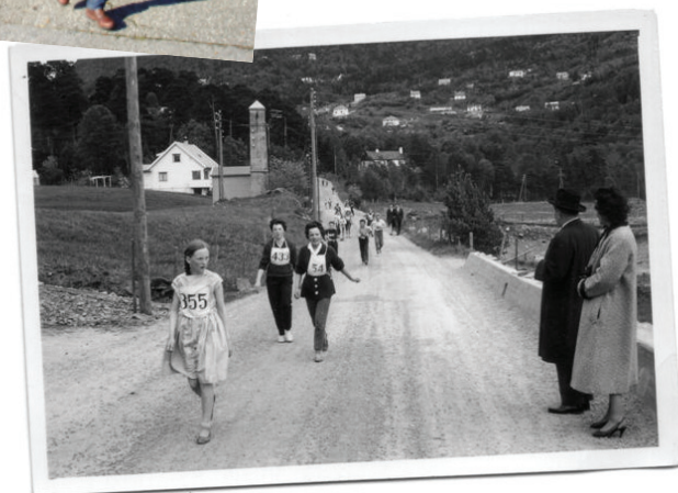
Bilder fra turen. Foto: Marianne Rasmussen. Det historiske bildet er tatt av Johs. Wergeland