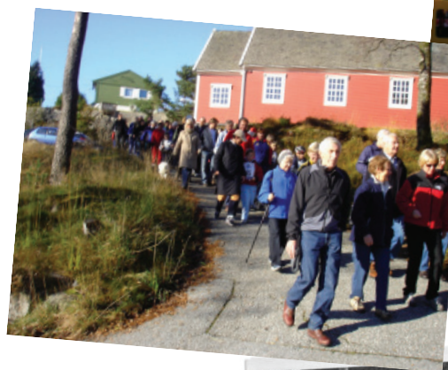
Fra starten ved Ungdomshuset