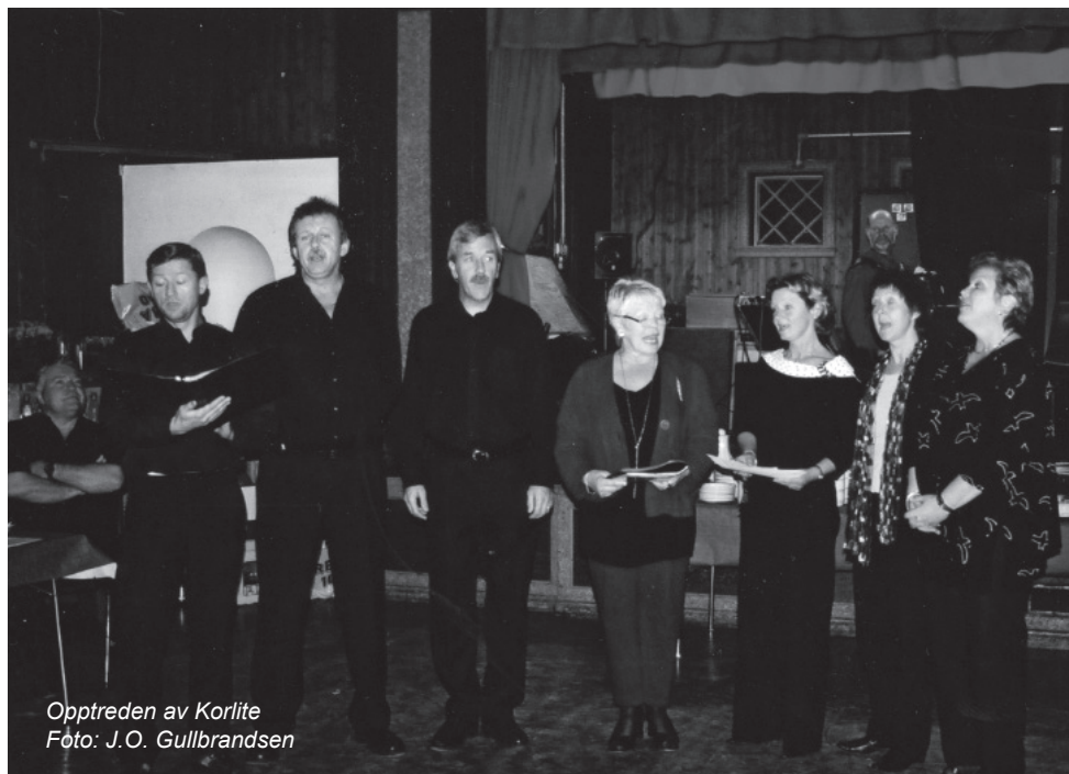
Opptreden av Korlite

Kjell Sælensminde holdt foredrag om "Min barndoms dal – Fyllingsdalen" og "Kor Lite" bidrog med flere sangnummer som vakte stor begeistring.