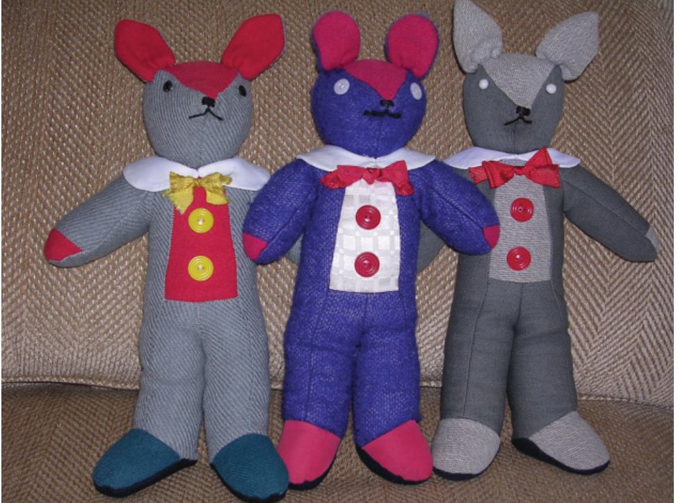
Et lite knippe 40-års gamle "Finabamsen".