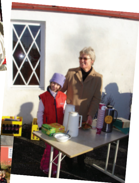
Pannekaker, kaffe og brus