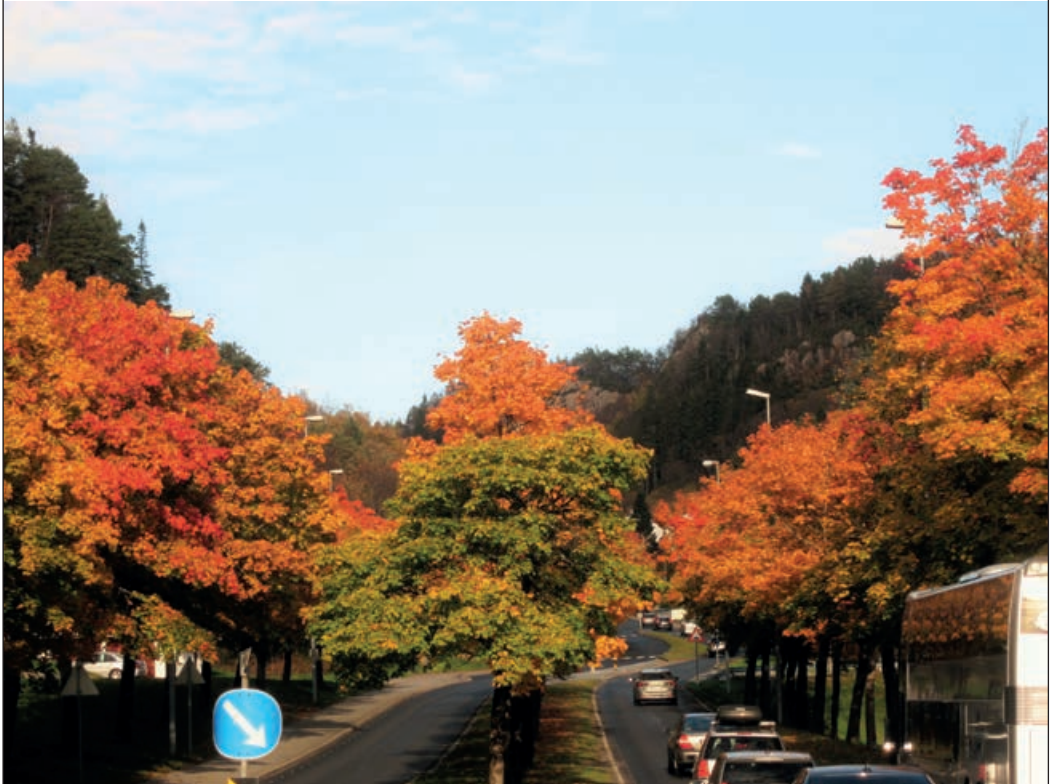
Høst i Fyllingsdalsveien

Returadresse: Kjell Sælensminde Ørnahaugen 63 5144 Fyllingsdalen Tlf. 41 44 57 73