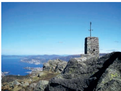
Varden på Løvsakken