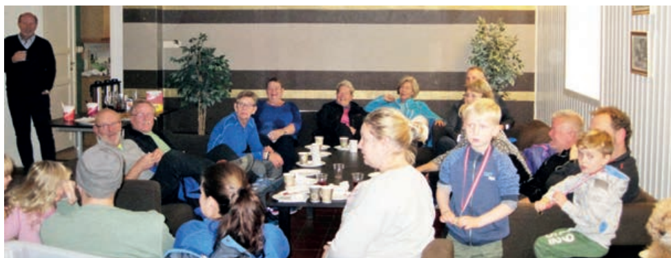
Saft, kaffe og vafler smaker godt etter endt dyst

På Krohnegårdsmarsjen var det også bare blide fjes å se på de ivrige turmarsdeltakerne som i tillegg også løste quiz-spørsmål med stor iver og som koste seg stort med saft, kaffe, vafler og premieutdeling i Ungdomshuset etter endt dyst.