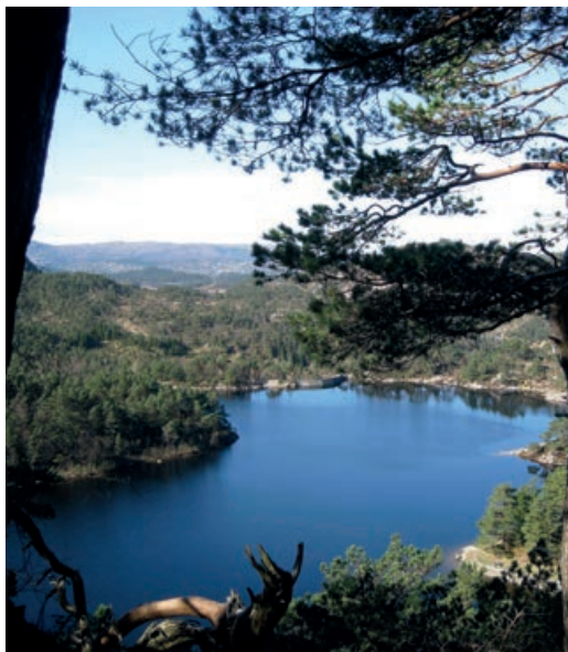
«Tindbækvand» Tennebekktjernet

Til Laksevaag med færgen, 20 min. Hovedveien nordvestlig forbi Laksevaags maskin- og jernskibsbyggeri og Holen til « Kringsjaa », 15 min., videre sydover til Gravdalsvandets sydøstre ende, 25 min. Her tar man av fra kjøreveien og gaar en gammel nedlagt vei opover dalen mot syd til det lille overmaate vakkert liggende Tindbækvand, 1.2 km., 20 min. Her er naaleskog og riktig trivelig natur. Paa fotstien på østre side av vandet, først sydlig og saa ret østlig i sving rundt det bratte Eikelifjeld. Veien er på lange strækninger myret, saa man skal ha tæt skotøy; men dette bør ikke avskrække fra at ta denne lønnsomme tur. Sko-