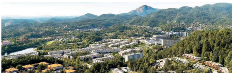
Fyllingsdalen sett fra Gulsteinen