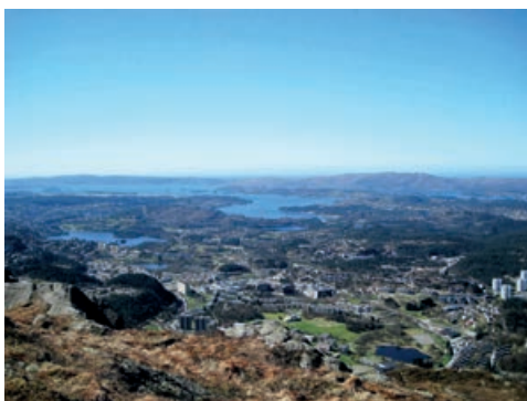
Fyllingsdalen sett fra Løvsakken