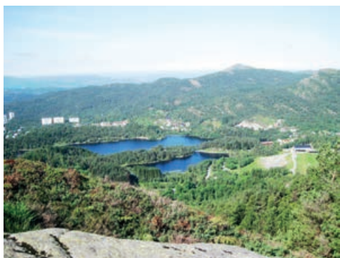
Mot skytebanen og Løvsakkvatnet

Løvsakken kan bestiges fra mange forskjellige kanter, mest vanlig fra Melkeplassen eller fra Krohnegården for oss fyllingsdøler. Fjellet er 477 m høyt og fra toppen har du utsikt over hele Bergen mot nord og øst, hele Laksevåg og Askøy mot nord, hele Fyllingsdalen og ut i havet mot vest og mot sør ser du på gode dager så langt sør som til Stord. En tur på Løvsakken er obligatorisk for alle Fyllingsdøler, her kan du skrive deg