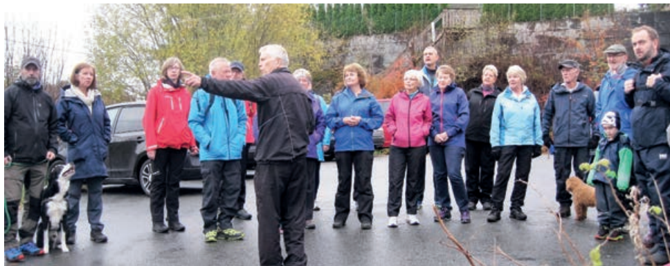
En del av deltakerne før start på Krohnegårdsmarsjen

Siste helgen under Kulturdagene, 29. og 30. oktober hadde Fyllingsdalen Historielag hele tre arrangementer. Lørdag 29. arrangerte vi «Byvandring med veteranbuss», guidet rundtur i dalen der vi fortalte om tiden før, under og etter innlemmingen i Bergen. Søndag 30. arrangerte vi «Krohnegårdsmarsjen» og hadde «Åpent hus» i Kårhuset. Kårhuset hadde 20 besøkende som alle skrøt av kaffe, vafler og historieformidlingen der.