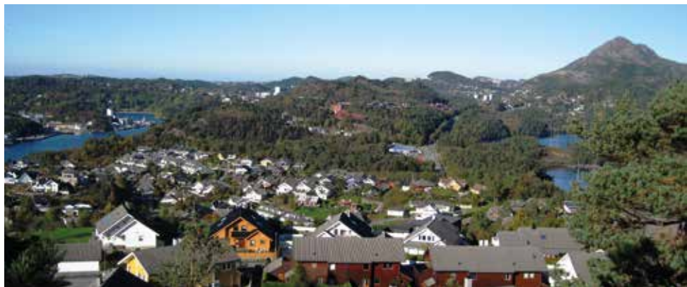
Bjerge med Lyderhorn bak til høyre