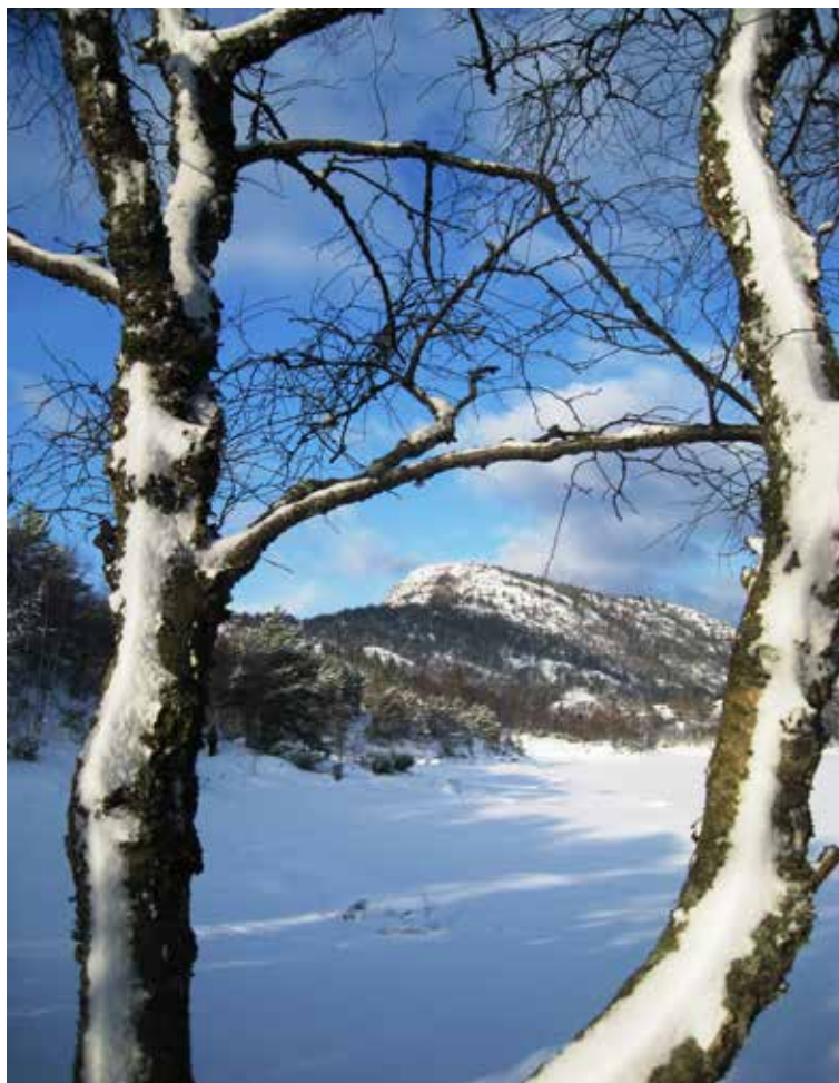
Vinter ved Storavatnet

Returadresse: Kjell Sælensminde Ørnahaugen 63 5144 Fyllingsdalen Tlf. 55 16 01 85