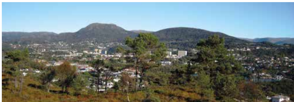
Fyllingsdalen med Løvestakken i bakgrunnen