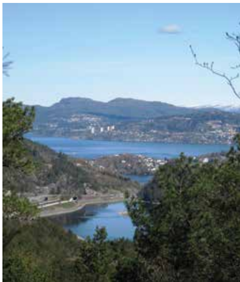
Askøy i bakgrunnen