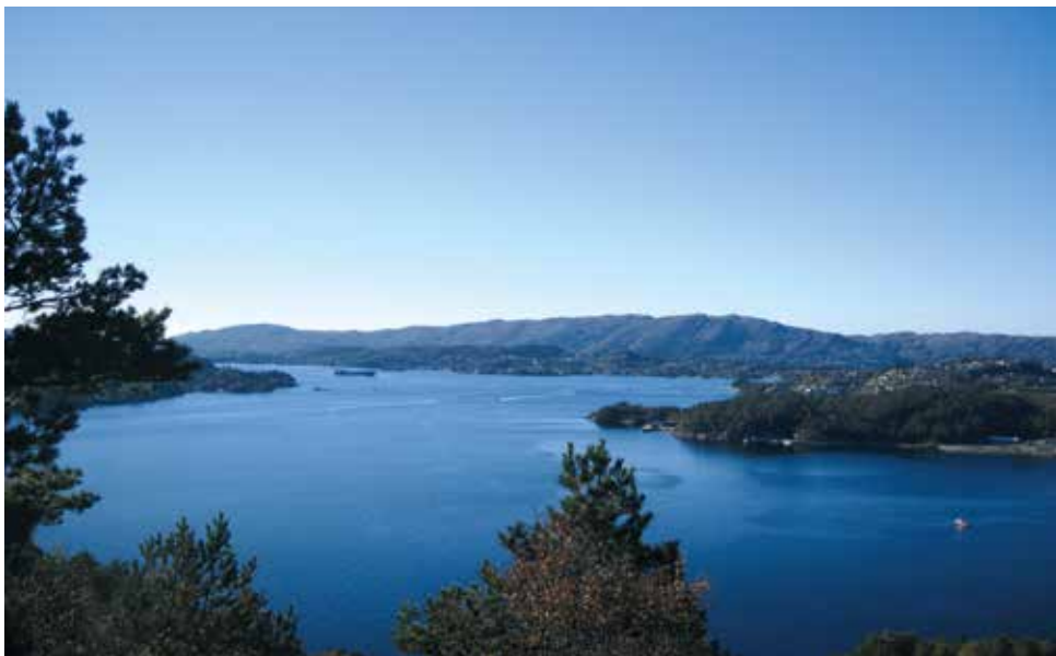
Vi ser mot Vattlestraumen, med Bjørøy/Sotra bak

I dette nr. av Fyllingsdølen og i de 2-3 neste, vil vi ta med en enkel billedreportasje som viser utsikten fra disse Fyllingsdalens sju fjell, kanskje vi kan friste noen til å besøke disse og med selvsyn konstatere de flotte utsiktspostene? Vi starter opp med utsikten fra Knappenfjellet.